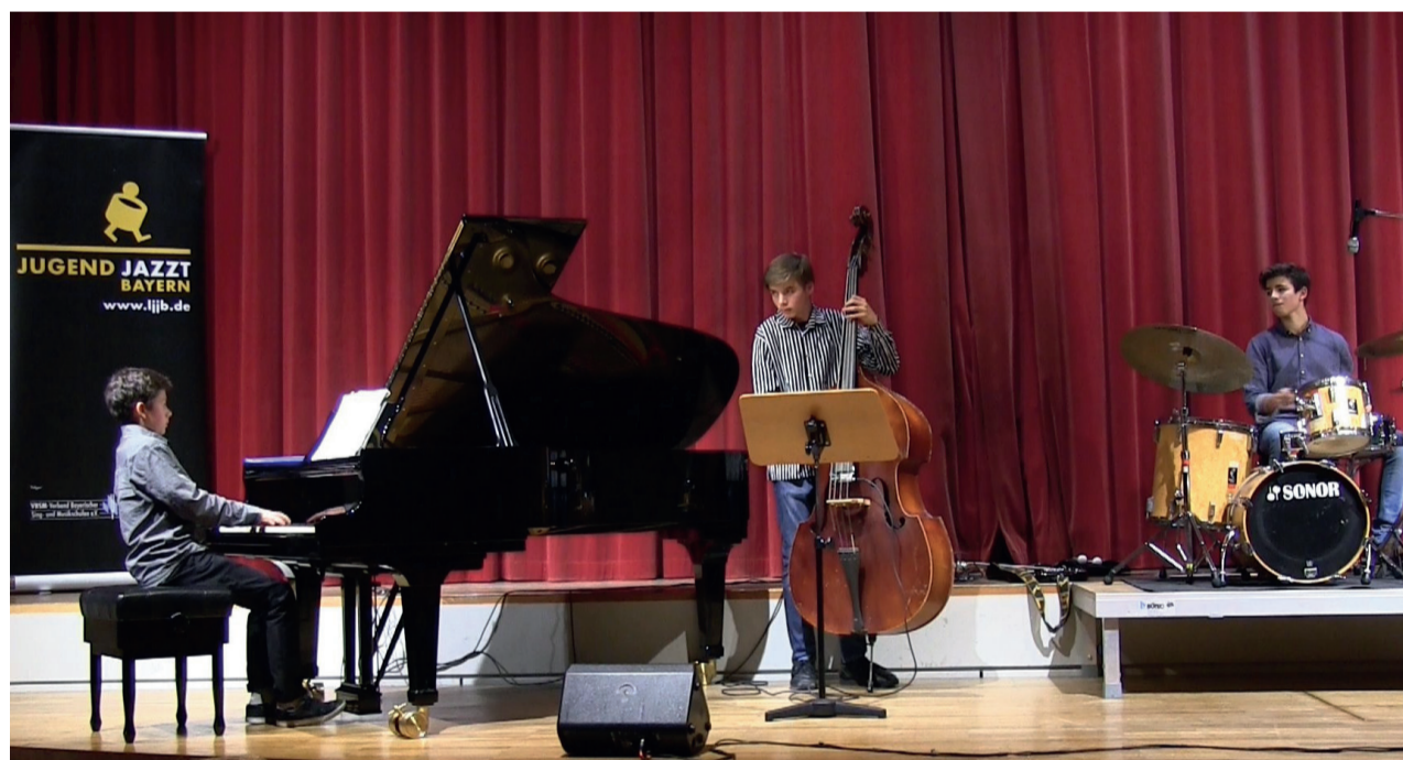
Der Vertreter Bayerns bei der Bundesbegegnung „Jugend jazzt“ 2017 in Saarbrücken: Das „Convenience Trio“ aus München.

Die höchste Wertung des Wochenendes ging an das „Convenience Trio“ aus München. Sie erhielten die Auszeichnung „mit hervorragendem Erfolg teilgenommen“ und damit auch die Weiterleitung an die Bundesbegegnung „Jugend jazzt“ für Combos 2017 in Saarbrücken. Die Jury um den künstlerischen Leiter Harald Rüschenbaum nahm sich in individuellen Gesprächen viel Zeit, um den jungen Jazzern Impulse und Ratschläge für ihre weitere Entwicklung zu geben. Jeder