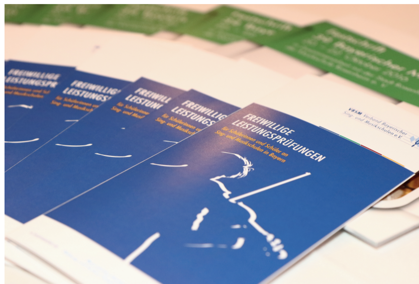
Die Freiwilligen Leistungsprüfungen – ein Beitrag des VBSM zur optimalen Förderung von Musikschülerinnen und -schülern.

Auch als Träger des Landes-Jugendjazzorchesters Bayern und des Landeswettbewerbs „Jugend jazzt“ Bayern erfüllt der VBSM zentrale Aufgaben in der musikalischen Förderung von Kindern, Jugendlichen und jungen Erwachsene-