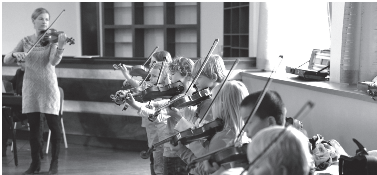
Musikschulen gewährleisten ein gelingendes soziales Miteinander.